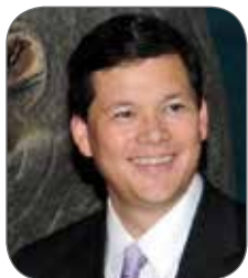
TIMOTHY R. REBBECK PROFESSEUR D'EPIDEMIOLOGIE DU CANCER A LA HARVARD THE CHAN SCHOOL OF PUBLIC HEALTH ET PROFESSEUR D'ONCOLOGIE MEDICALE A DANA-FARBER CANCER INSTITUTE "L'avenir de la génomique dans la prise en charge du cancer"