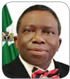
ISAAC ADEWOLE MINISTRE DE LA SANTE DU NIGERIA "Etre Ministre de la Santé en Afrique"